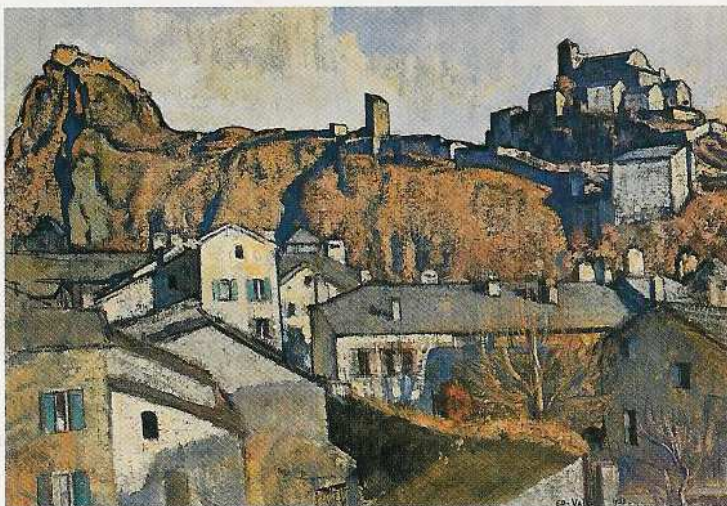
Sion I, 1928.